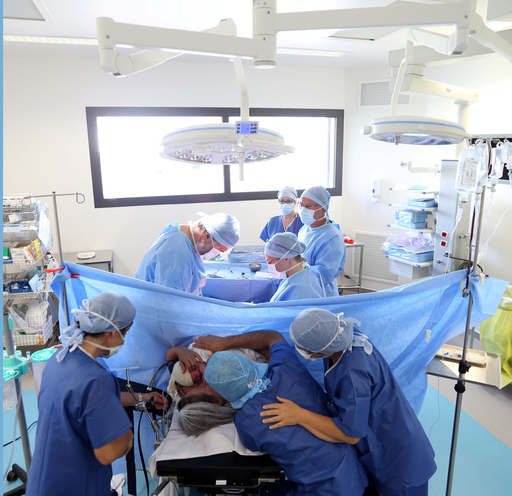
Peau à peau après césarienne en présence du père, à la maternité d'Arcachon.

Dr Amblard : Beaucoup de pratiques préconisées par l'IHAB se répandent peu à peu mais les professionnels ignorent souvent que la démarche va bien au-delà de l'allaitement et s'adresse tout autant aux mamans qui font le choix du biberon. C'est une démarche exigeante, qui oblige à se remettre en question sans cesse et à se positionner à l'avant-garde.